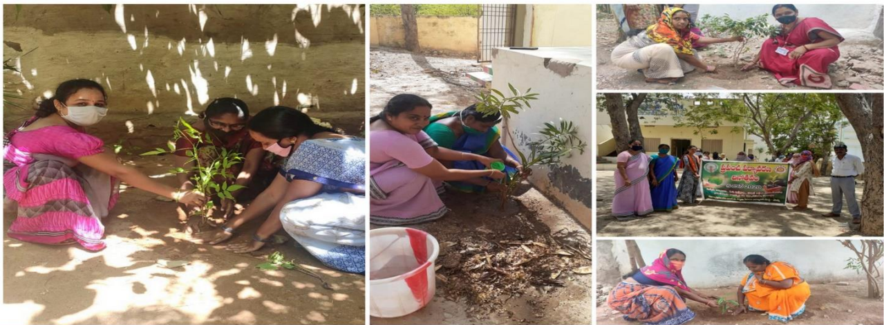
Mission for Elimination of Poverty in Municipal Areas (MEPMA-AP) - PRAKASAM