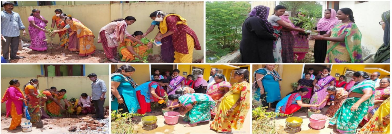
Mission for Elimination of Poverty in Municipal Areas (MEPMA-AP) - NELLORE