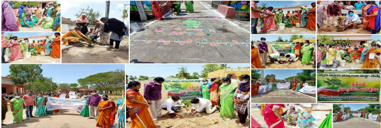
Mission for Elimination of Poverty in Municipal Areas (MEPMA-AP) - Krishna & VMC