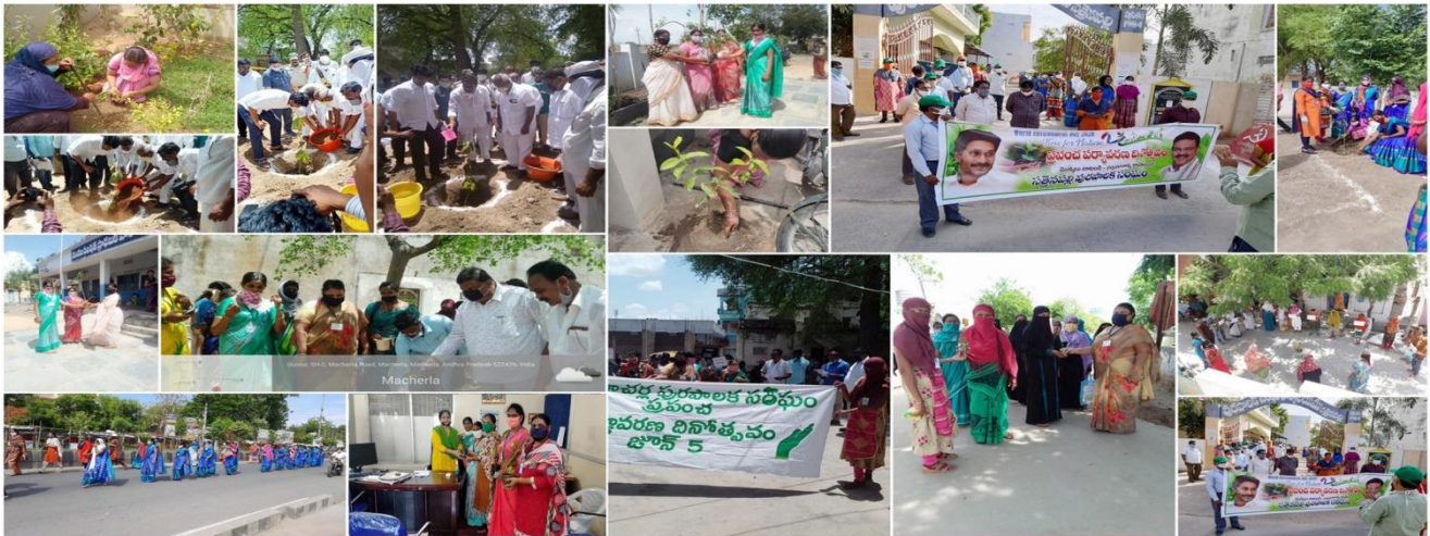
Mission for Elimination of Poverty in Municipal Areas (MEPMA-AP) - Guntur