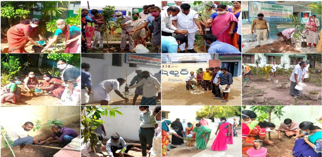
Sapling Plantation event in Shelter for Urban Homeless(SUHs) across the State