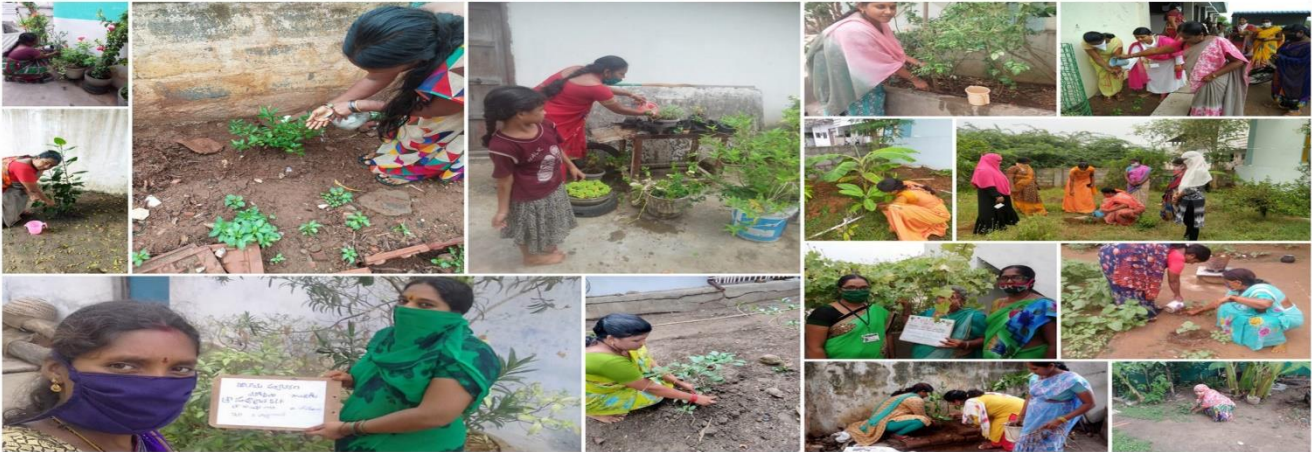
Mission for Elimination of Poverty in Municipal Areas (MEPMA-AP) - EAST GODAVARI