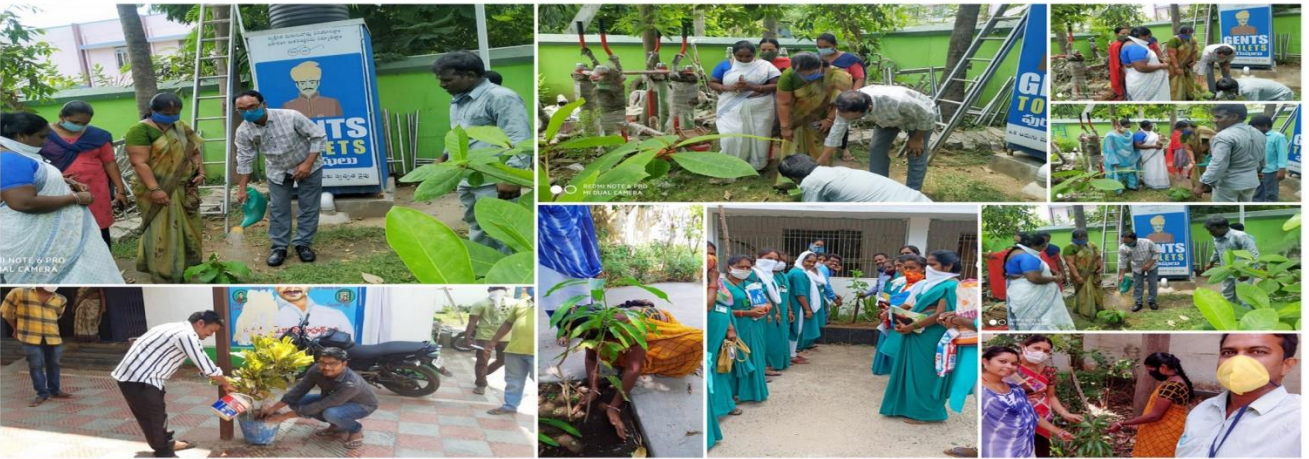
Mission for Elimination of Poverty in Municipal Areas (MEPMA-AP) - SRIKAKULAM