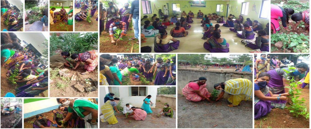
Mission for Elimination of Poverty in Municipal Areas (MEPMA-AP) - Visakhapatnam & GVMC