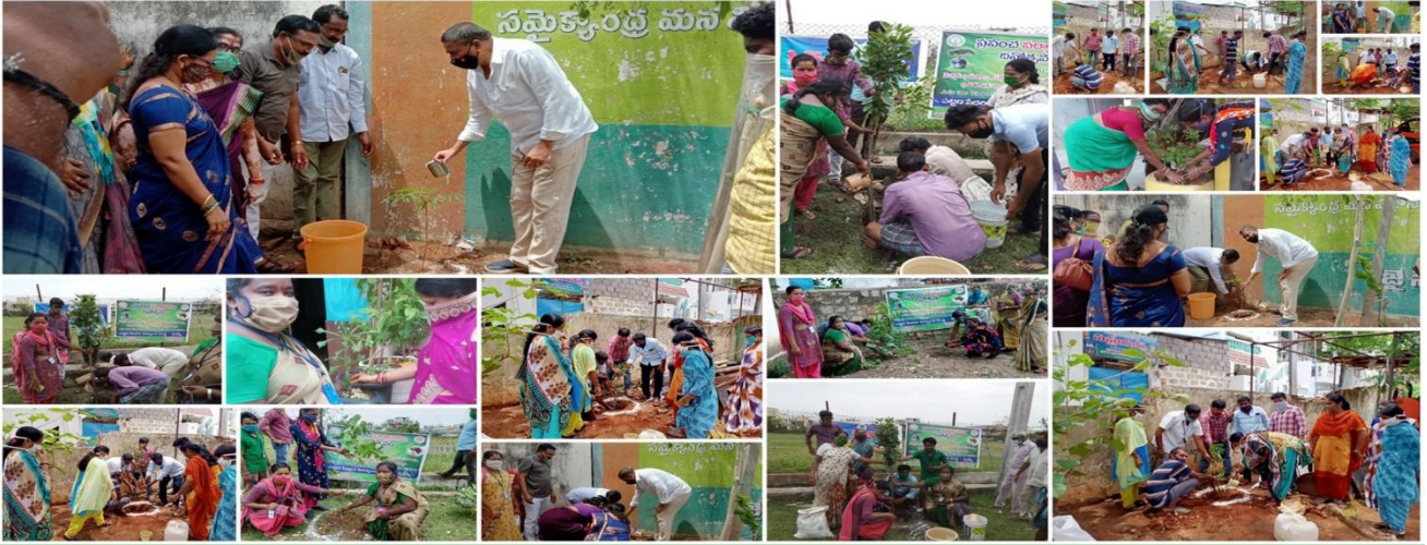
Mission for Elimination of Poverty in Municipal Areas (MEPMA-AP) - Vizanagaram