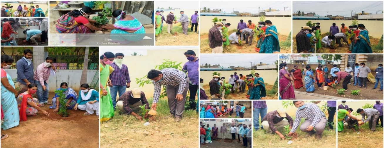
Mission for Elimination of Poverty in Municipal Areas (MEPMA-AP) - West Godavari