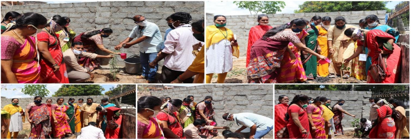
Mission for Elimination of Poverty in Municipal Areas (MEPMA-AP) - CHITTOOR