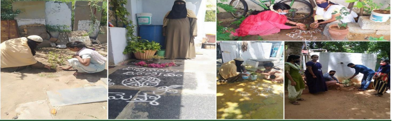
Mission for Elimination of Poverty in Municipal Areas (MEPMA-AP) - ANANTHAPUR