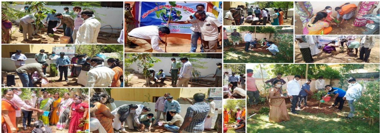
Mission for Elimination of Poverty in Municipal Areas (MEPMA-AP) - KADAPA