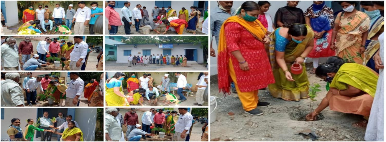
Mission for Elimination of Poverty in Municipal Areas (MEPMA-AP) - KURNOOL